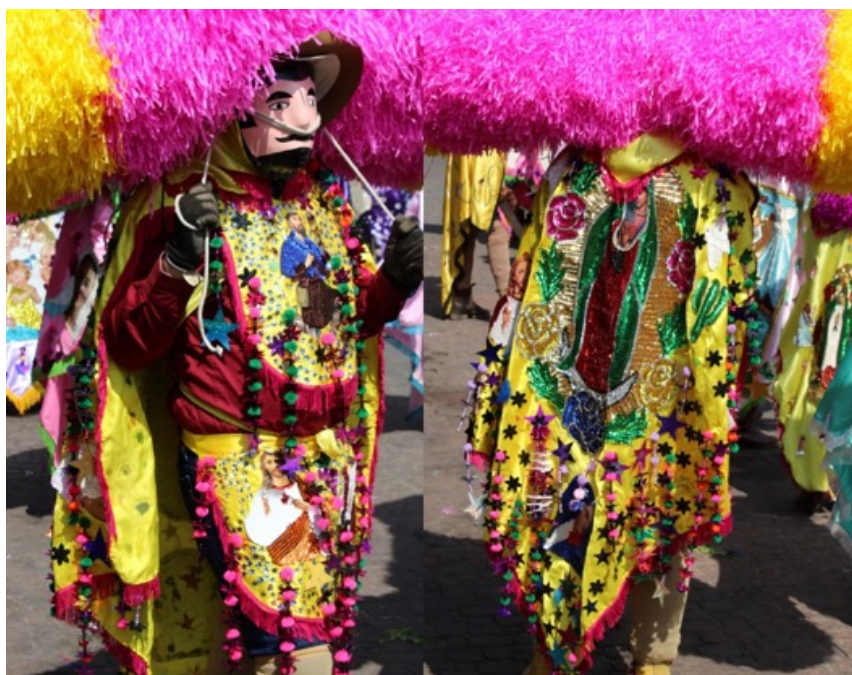
Figura 2. Buganvilia: El Sayón. Tetela del Volcán, Morelos, 2023