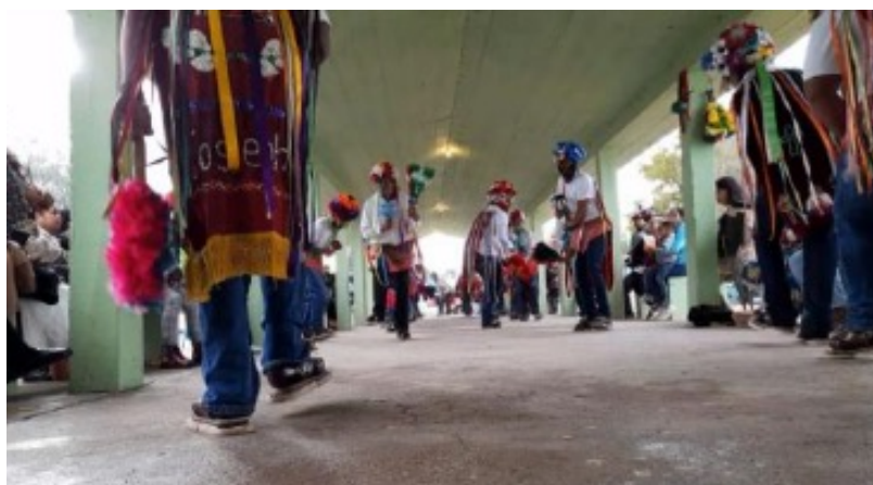
Figura 1. Danza de Matlachines de la comunidad de la Fracción Saín Alto

La tradición es una construcción social, la cual debe cambiar temporalmente, de una generación a otra, sobre todo de un lugar a otro, pues cada grupo específico con un contexto específico, posee una cultura y tradición propia, de manera que la identidad de dicho grupo se construye social y culturalmente a partir de las diferencias que existen en las tradiciones, realzando así una especie de selección cultural.