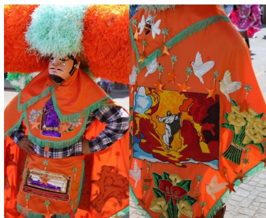
Figura 1. Anaranjado. El Sayón, Tetela del Volcán, Morelos, 2023

Aunado a lo anteriormente abordado, es momento de poner en práctica lo plasmado en las líneas pasadas, analizar este elemento visual predominante en la composición de la indumentaria del “Sayón” de Tetela del Volcán: el color, y de igual forma analizar los elementos que ornamentan estos ajuares a partir del aporte de Chevalier (1986) en su diccionario de los símbolos y de Fraticola (2010) en su aporte sobre la comunicación y el simbolismo del color, textos que abordan desde la mirada del pasado para comprender el significado de los elementos que nos rodean y a su vez, desde la óptica de la comunicación y la psicología de la percepción/color, haciendo un puntal énfasis en el abordaje religioso, elemento que concierne de manera directa al “Sayón”, siendo este la columna vertebral de su figura.